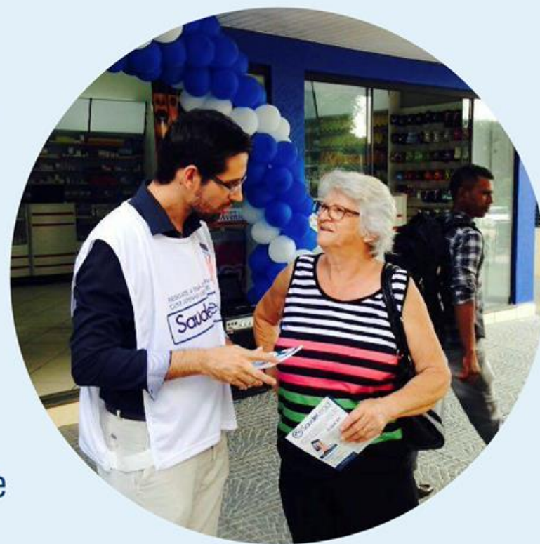
Lançamento oficial 05/12/2016 Nova Mutum/MT

Agora o programa já está na pauta do Prefeitura de Cuiabá para ser implantado na capital do estado.